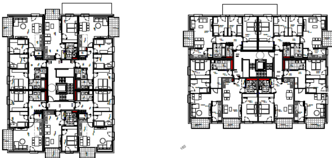
Grundriss: 6-Spanner/Etage – Mix aus 2-ZKB, 3-ZKB, 4ZKB zwischen 46 m 2 -95 m 2 (ca.)