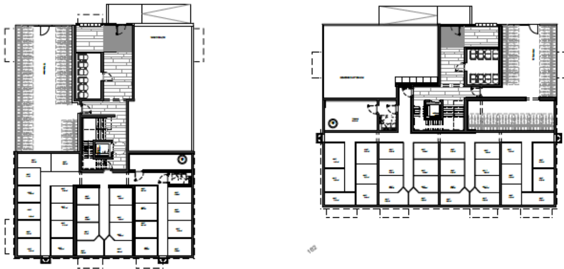
Grundriss: Gemeinschaftsräume – großzügige Fahrradräume - Mieterkeller